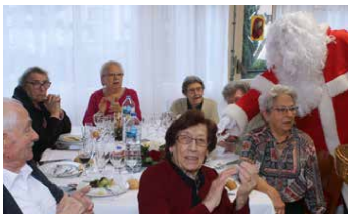
Repas de fin d'année à la Résidence Saint-Exupéry