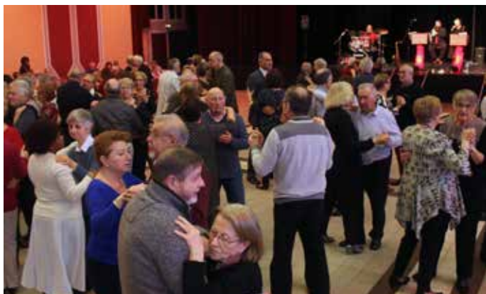
Quelques pas de danse après la dégustation de la galette