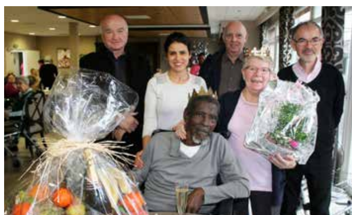
Lors de la galette de la Résidence Saint Vincent de Paul