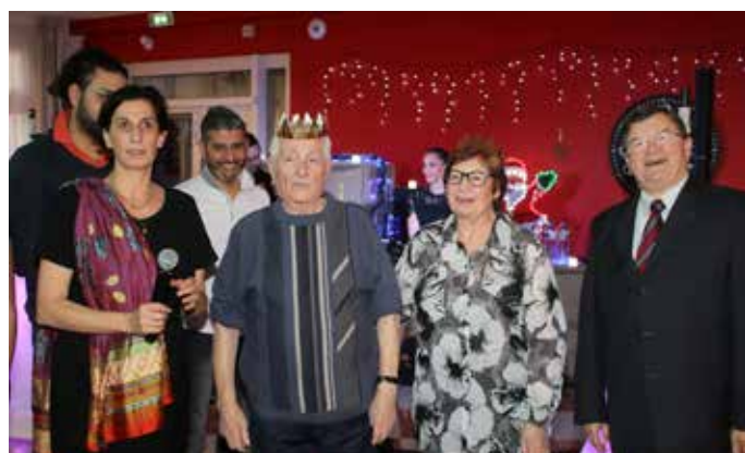
Le couronnement du roi et de la reine à Saint-Exupéry