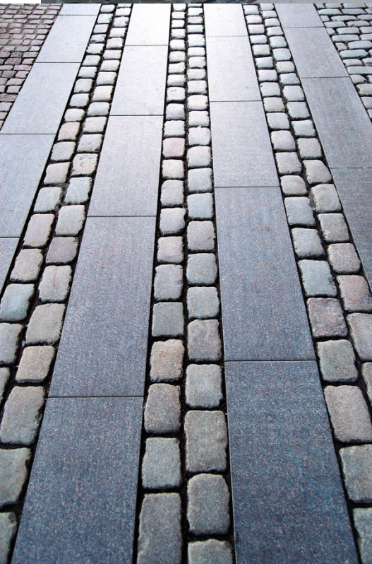
Calepinage du parvis