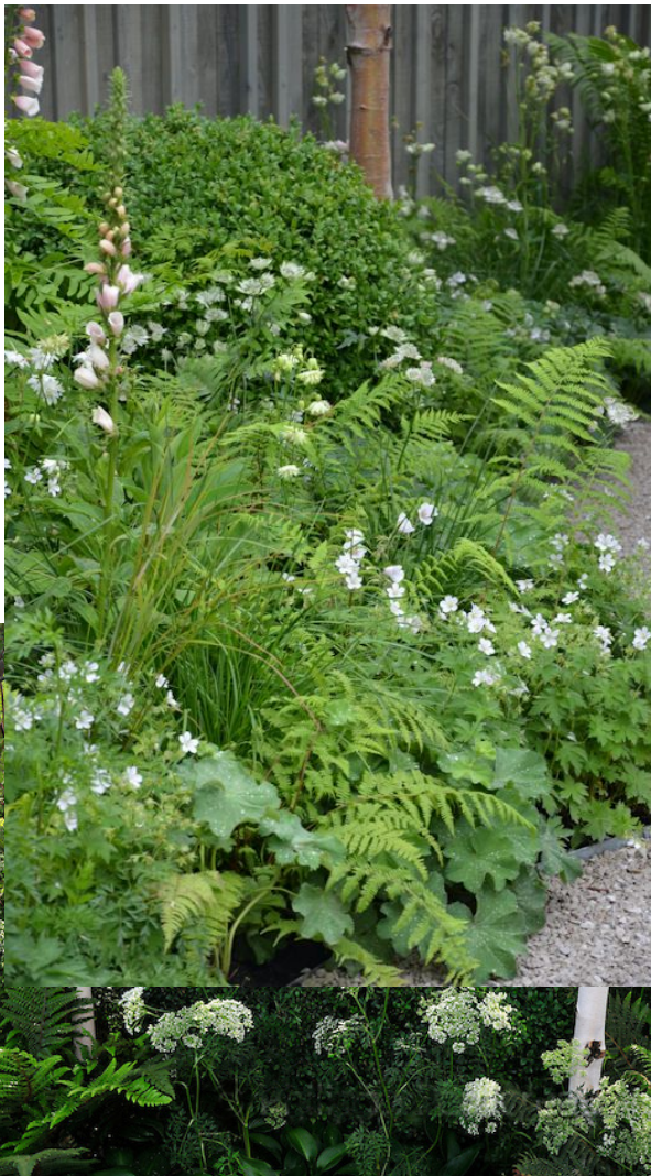
Jardin Blanc Photos de références

Ce jardin est conçu pour fonctionner dans l'emprise foncière dédiée au crématorium et se connecter à terme au cimetière paysager avec le prolongement du cheminement créé pour aboutir au parvis ovale situé à l'entrée du cimetière.