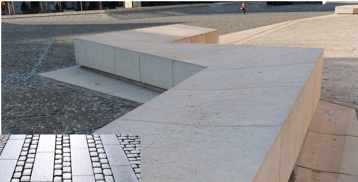
Bancs design en pierre

Le parvis est éclairé par des candélabres de faible hauteur (4 à 5 mètres). Toutes les serrureries des espaces extérieurs sont laquées d'un même RAL gris anthracite, celui déjà utilisé pour le mobilier du cimetière (7016).