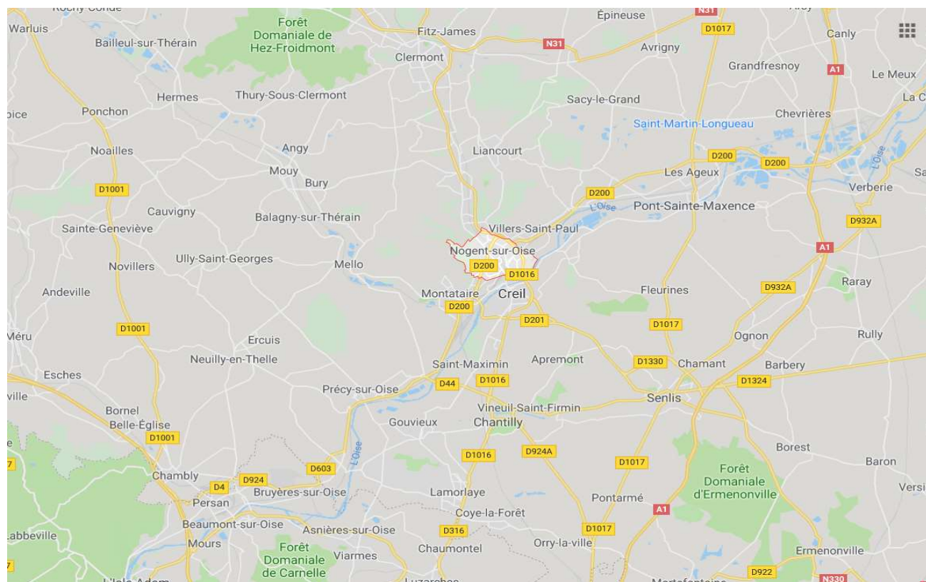
Commune de Nogent-sur-Oise Création d'un parc nature sur le site du Marais Monroy (réhabilitation d'une zone humide) Dossier de demande de Déclaration d'Utilité Publique - Notice explicative