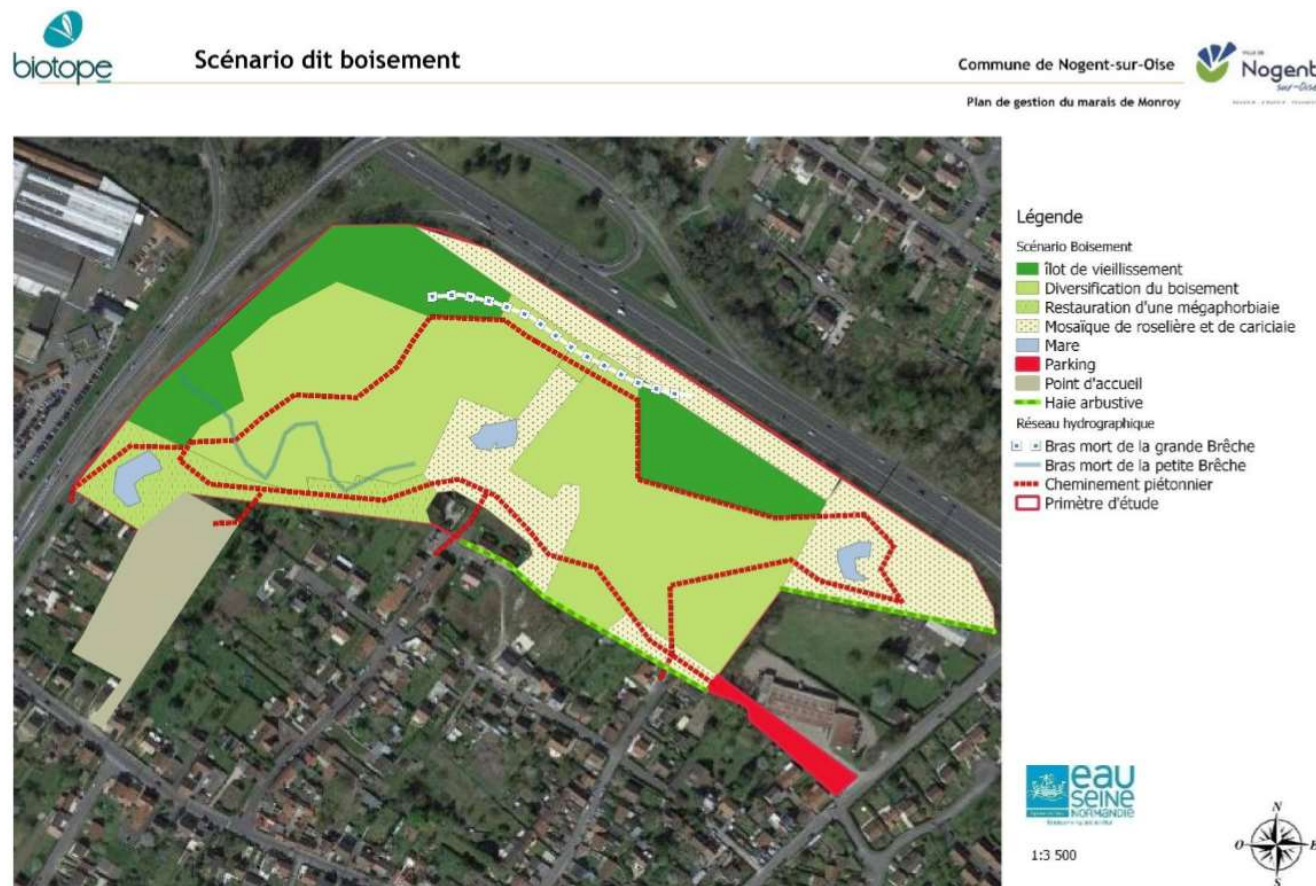
Commune de Nogent-sur-Oise Création d'un parc nature sur le site du Marais Monroy (réhabilitation d'une zone humide) Dossier de demande de Déclaration d'Utilité Publique - Notice explicative