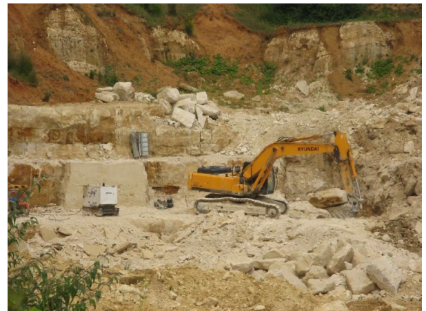
Reprise des blocs à la pelle hydraulique